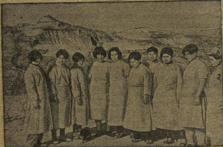
На снимке: Отряд китайских девушек-медицинских сестер госпиталя.

Китайские женщины принимают активное участие в борьбе своего народа против японцев. Они ведут большую агитационную работу среди населения прифронтовых деревень, ухаживают за ранеными бойцами, участвуют в военных операциях.